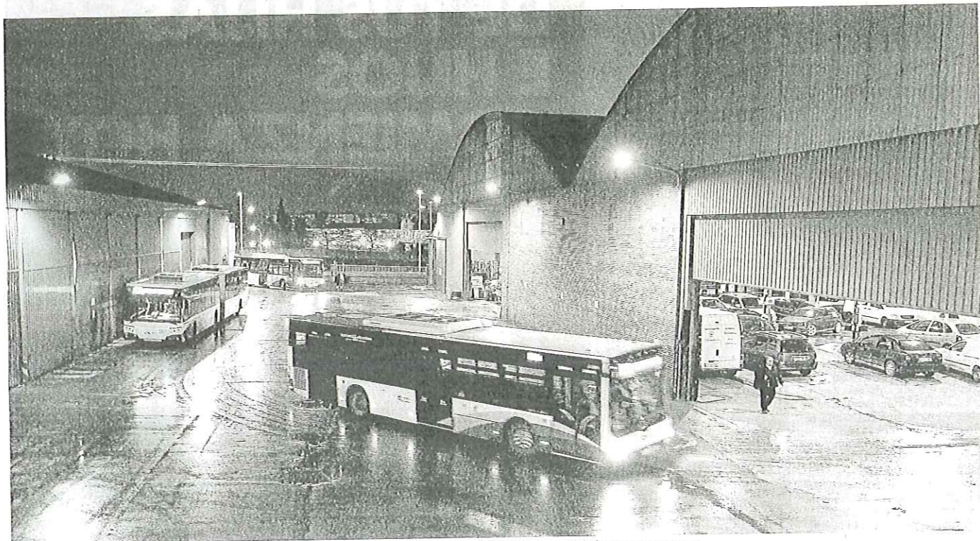
Tres autobuses rígidos maniobran para entrar en las cocheras situadas en la calle Camino del Canal, en Ezkaba.

local@noticiasdenavarra.com comarcas@noticiasdenavarra.com