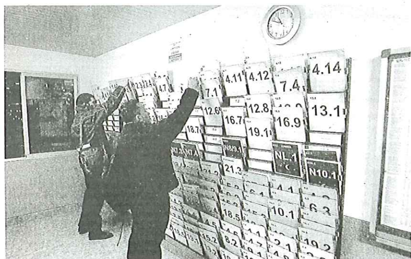
Dos conductores dejan la tablilla del autobús, en la que está el horario que debe cumplir la línea.