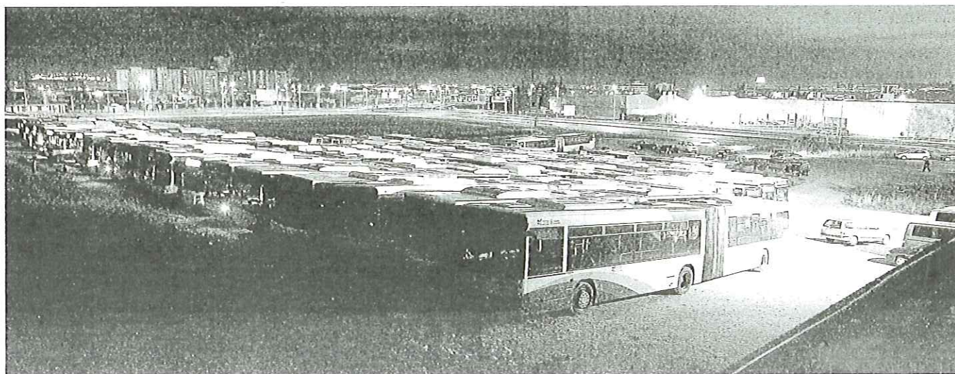
Los articulados pasan la noche en la campa situada junto a las cocheras de Ezkaba; los que tienen los intermitentes dados están a falta de la limpieza y del repostaje.

Valle del Ebro. Más de 90 profesores protestan contra los recortes en limpieza que provocan "un deterioro en las condiciones higiénicas del centro". P. 24